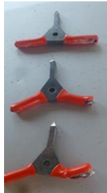
Les trois étoiles après percement du pneu