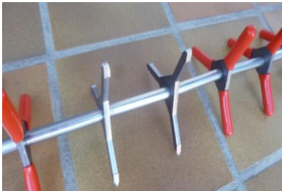
Capuchons PVC enlevés