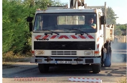
KROTAL - TRI - CAP -