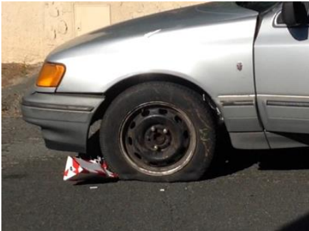
KROTAL - TRI - ET - RESTE ACCROCHEE DANS LE PNEU

KROTAL peut percer les pneus des véhicules civils routiers